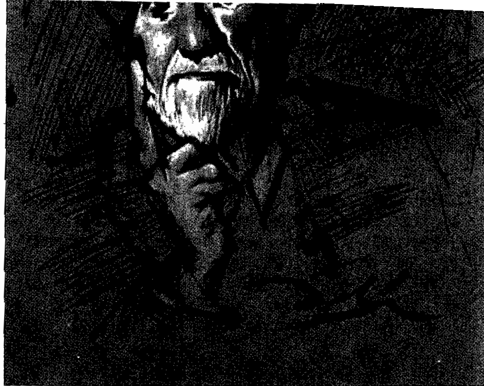
Freud tegnet af Dali.

I begyndelsen, i en lille menneskeflokk, afgjorde den stærkeste muskelkraft, hvem noget skulle tilhøre eller hvis vilje der skulle udføres. Muskelkraft forstærkes og erstattes snart af brugen af værktøj; den, der har de bedste våben eller anvender dem med mest snilde, sejrer. Med indførelsen af våbnet begynder den åndelige overlegenhed allerede at indtage den rå muskelkrafts plads; kampens endelige formål er det samme, den ene part skal, pga. de beskædigelser han påføres og lammelsen af hans kræfter, tvinges til at opgive sit krav eller sin protest. Det opnås