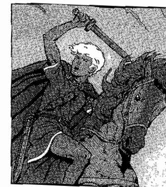
Tegneserier Alix, den tapre romer, slår til igen. Side 13

Brev fra fortiden. Er det muligt at befri menneskene fra krigens svøbe? Dette spørgsmål stillede Albert Einstein Sigmund Freud i 1932. Freuds svar har ikke mistet sin aktualitet i dag.